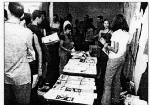
Asamblea ciudadana, en La Laguna.

Lo que sí confirmó el miembro de la Asamblea es que las obras del Puerto de Granadilla se recurrirán por vía legal y por vía administrati-